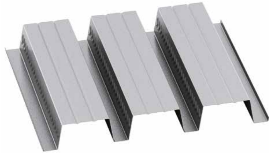
EGB 1200 H=14 cm